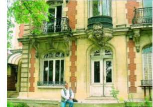
Agrandir la photo

D'autant que la maison, qui date de la fin XIXe début XXe siècle et a été construite par André Vin, bonnetier, présente de nombreux atouts. Sur une surface de 400 à 500 m 2 , les pièces sont réparties sur quatre niveaux et offrent quelques belles surprises.